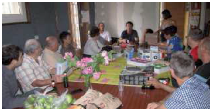
Une vue du public lors du tirage de la tombola

statuts nationaux adoptés en congrès. On mesure ainsi l'importance de la tombola départementale pour la fédération de Savoie et on comprend pourquoi des militants se mobilisent pour en assurer le succès.