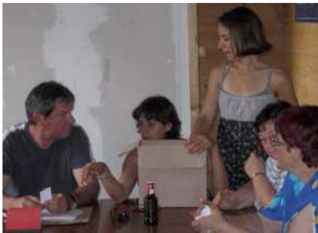
Le tirage de la tombola