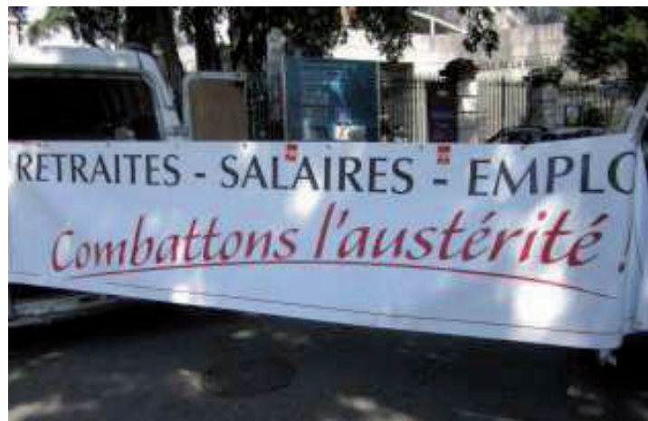
Une banderole de la CGT lors d'un rassemblement à Chambéry

Sommaire : Editorial - Fête des Allobroges - Réunion publique sur la réforme territoriale - Voeu non souhaité à Moûtiers - Le PCF 73 et les sénatoriales - Hervé Gaymard pousse les feux de la fusion des deux Savoie - Débat sur le loup - Manifestations de soutien aux Palestiniens - Fête de l'Humanité - Un grand débat à la fête des Allobroges.