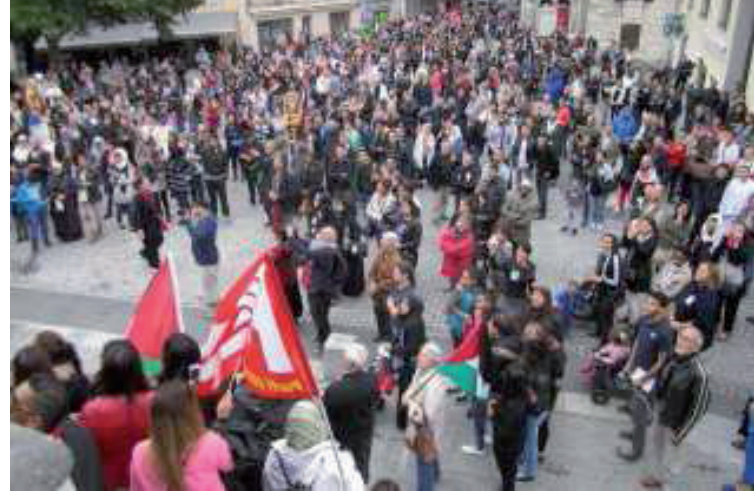
Manif à Chambéry

C'est parce que cette résistance palestinienne était en passe de résoudre ses conflits internes et s'unissait autour d'un gou-